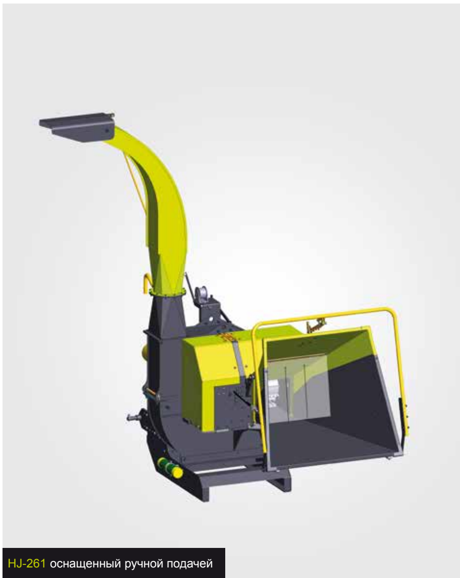
HJ-261 оснащенный ручной подачей